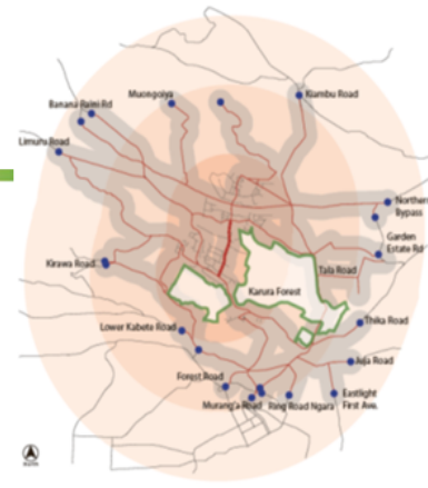
Cycling Reach from UN Avenue 10 min. 2.50 km 20 min. 5.00 km 30 min. 7.50 km UN Avenue max. circulation in 30min Streets covered Figure 8: Cycling Area of Influence