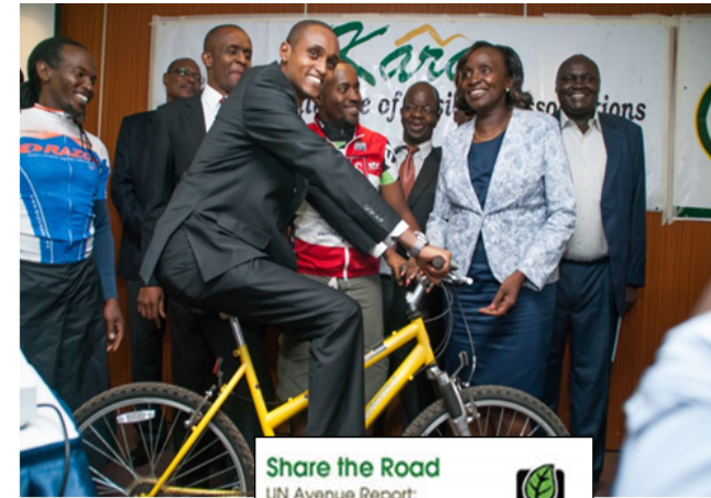
Share the Road UN Avenue Report: Kenya Showcase Project